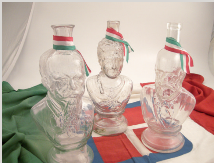
L'Unità d'Italia: Il Re, la Regina e Garibaldi

Villa Rosa is part of a series of Liberty buildings established in Italy at the beginning of '900 , most of them still existing It has been bought by Italian government in 1992 and , after restoration ,it has become the site of Altare's Glass Art Museum Nowadays the buildings is a cultural centre which includes the glass Art Museum and the Glass Library .