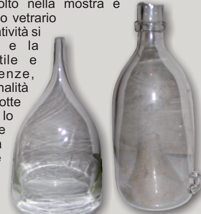
Filtro per Moscato e "Nassa" per pesci

Il "vetro d'uso" raccolto nella mostra è testimone di un mondo vetrario in cui nel tempo la creatività si è fatta invenzione e la fantasia oggetto utile e stravagante. Esigenze, tecniche e professionalità che si perdono nella notte dei tempi e che sono lo specchio delle usanze e delle necessità della popolazione altarese e valbormidese.